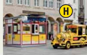
Linz City Express, Linz Hauptplatz